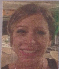
A cura dell'Avvocato Giorgia Viola

Per inviare un quesito ai nostri esperti scrivi a: repubblica@mail.com